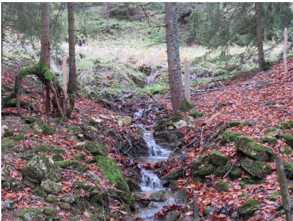
Un très intéressant débit pour le ruisseau à vent de la Côte du Bas-du-Chenit.