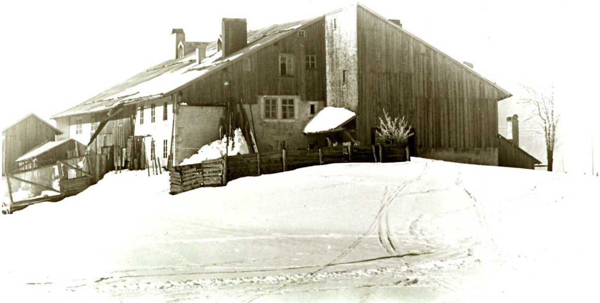
Crêt chez Berney au milieu du XXe siècle.