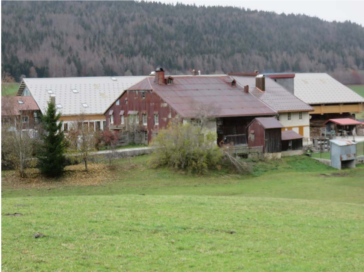
En face, les bâtisses du Crêt chez Berney, avec la belle grosse ferme du côté oriental de la route du Brassus à Bois-d'Amont, et la scierie Berney du côté occidental. On y rajoutait un bout chaque année, nous avouera notre accompagnateur !